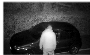
Image nocturne en obscurité totale grâce aux LED infrarouge, portée 8 à 15 mètres.