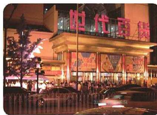
Image nocturne en éclairage urbain