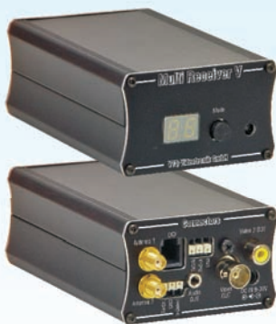
Multi-Empfänger V / Multi Receiver V