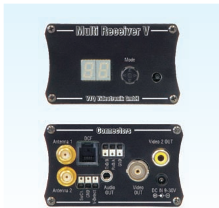
Multi-Empfänger V / Multi Receiver V

Delivery incl. mains adapter and 0dB antenna