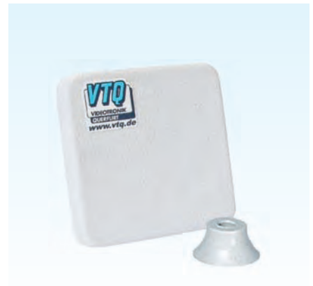
Zirkularantennen / Circular antenna