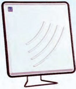
Richtantenne mit optionalem Standfuß Directional antenna with optional floor stand