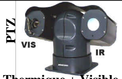
Thermique + Visible MG-TA