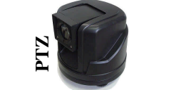
Zoom motorisé x27 RPT-270