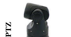
Zoom motorisé x36 WCA-E361