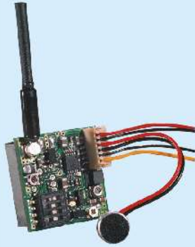
Mini TV Sender / Mini TV Transmitter